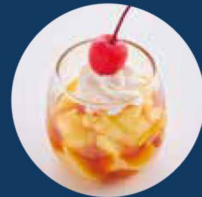
キッズミニプリン Mini Custard Pudding +¥140