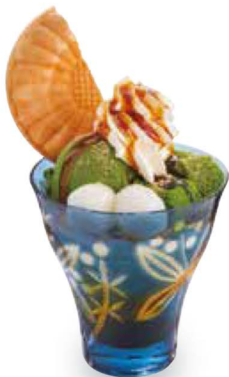
黒蜜抹茶わらびパフェ Matcha & Warabimochi Parfait with Brown Sugar Syrup