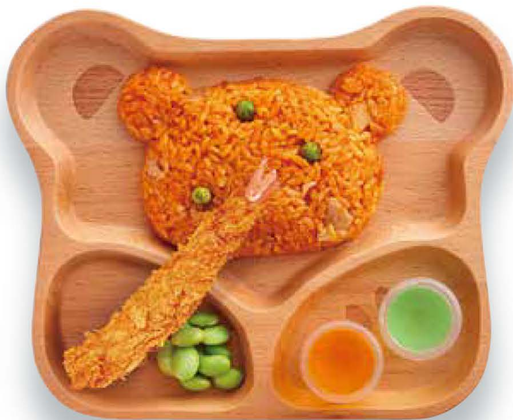
キッズプレート チキンライス Kids Plate -Chicken Rice-