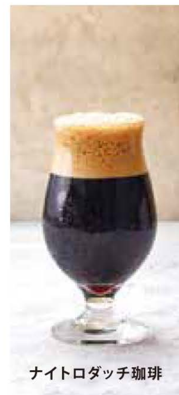
ナイトロダッチ珈琲