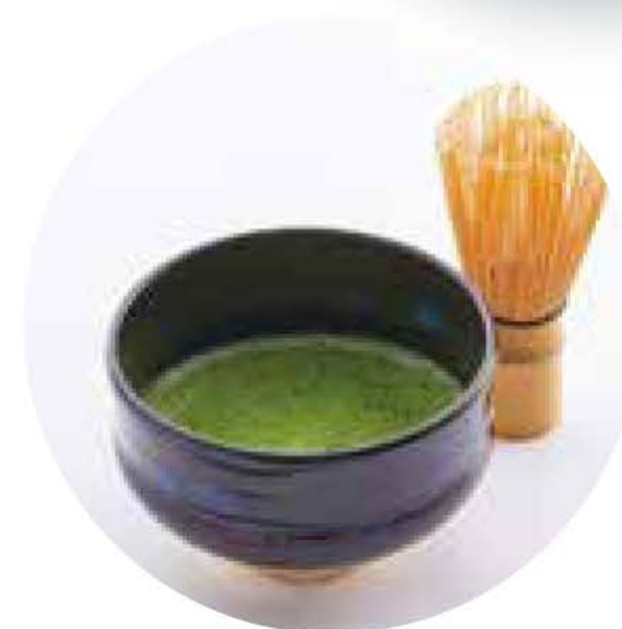
抹茶 + ¥230 Matcha