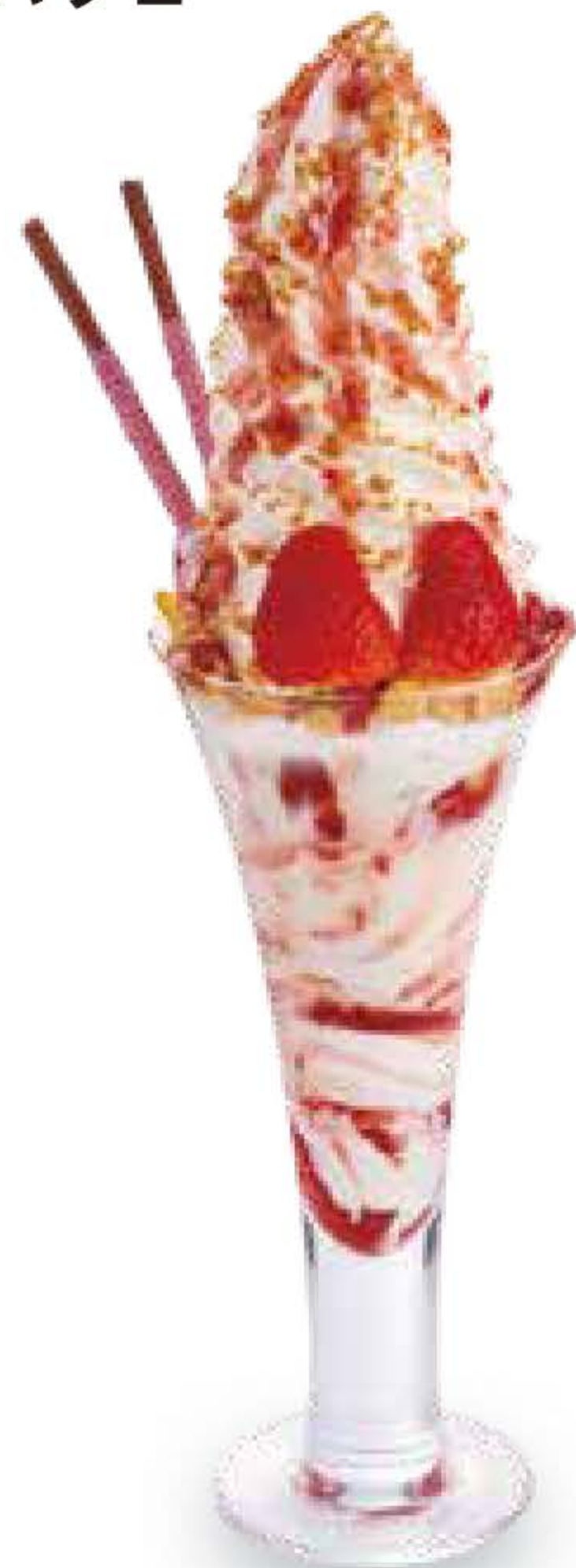
ジャンボソフトパフェ ストロベリー Jumbo Soft-Serve Parfait -Strawberry-

ソフトクリームたっぷりのジャンボパフェ。 いちごをトッピングしたかわいいPARFAIT。