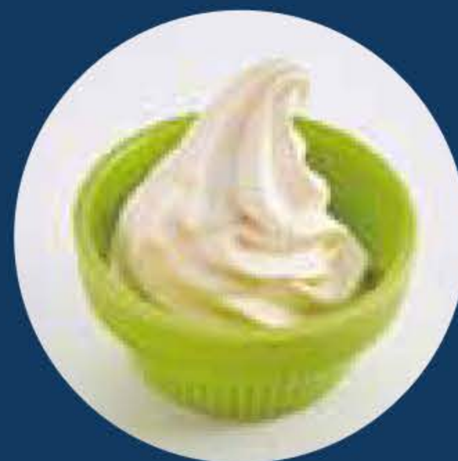
キッズミニソフト Mini Soft-Serve +¥120