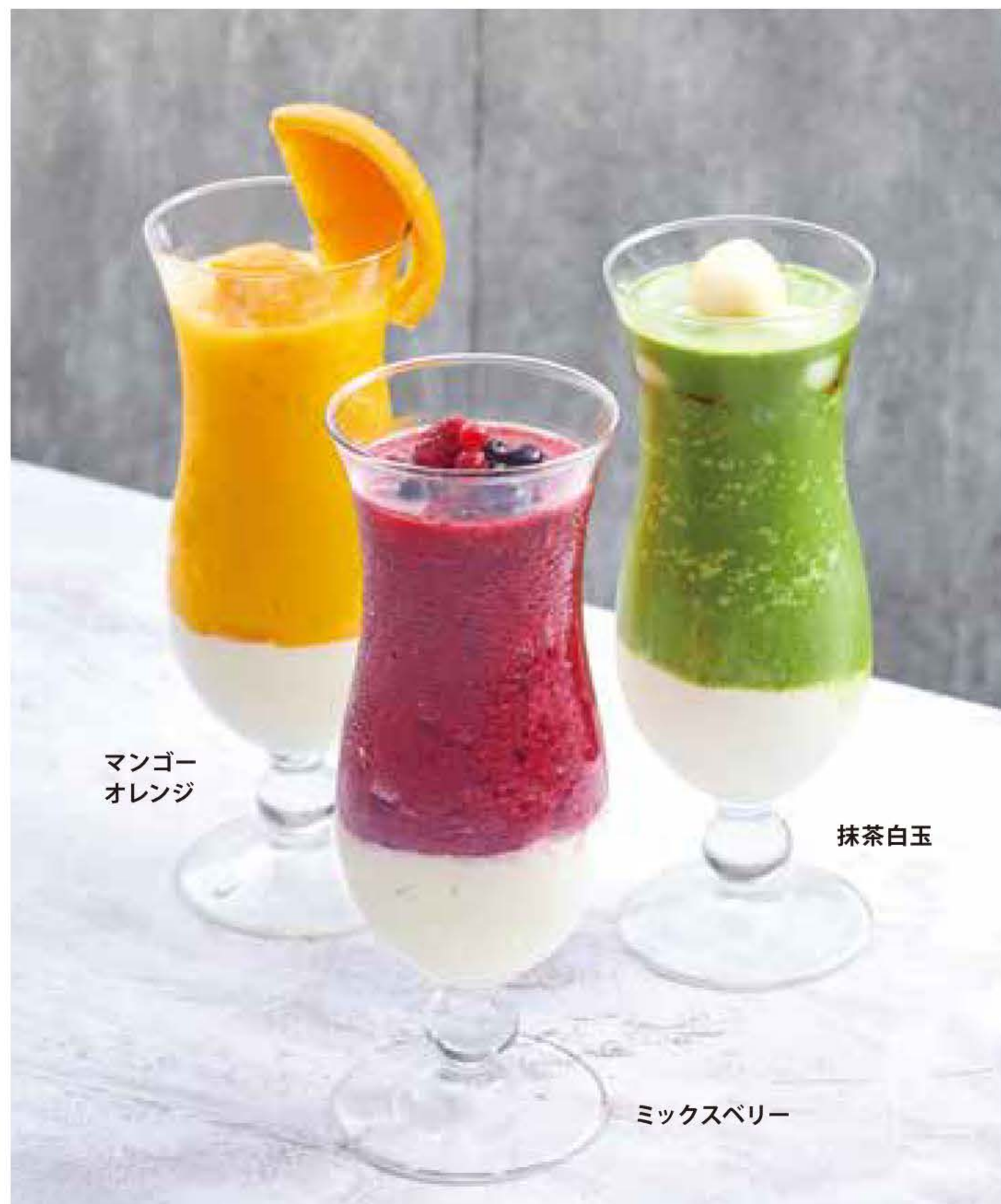
マンゴー オレンジ