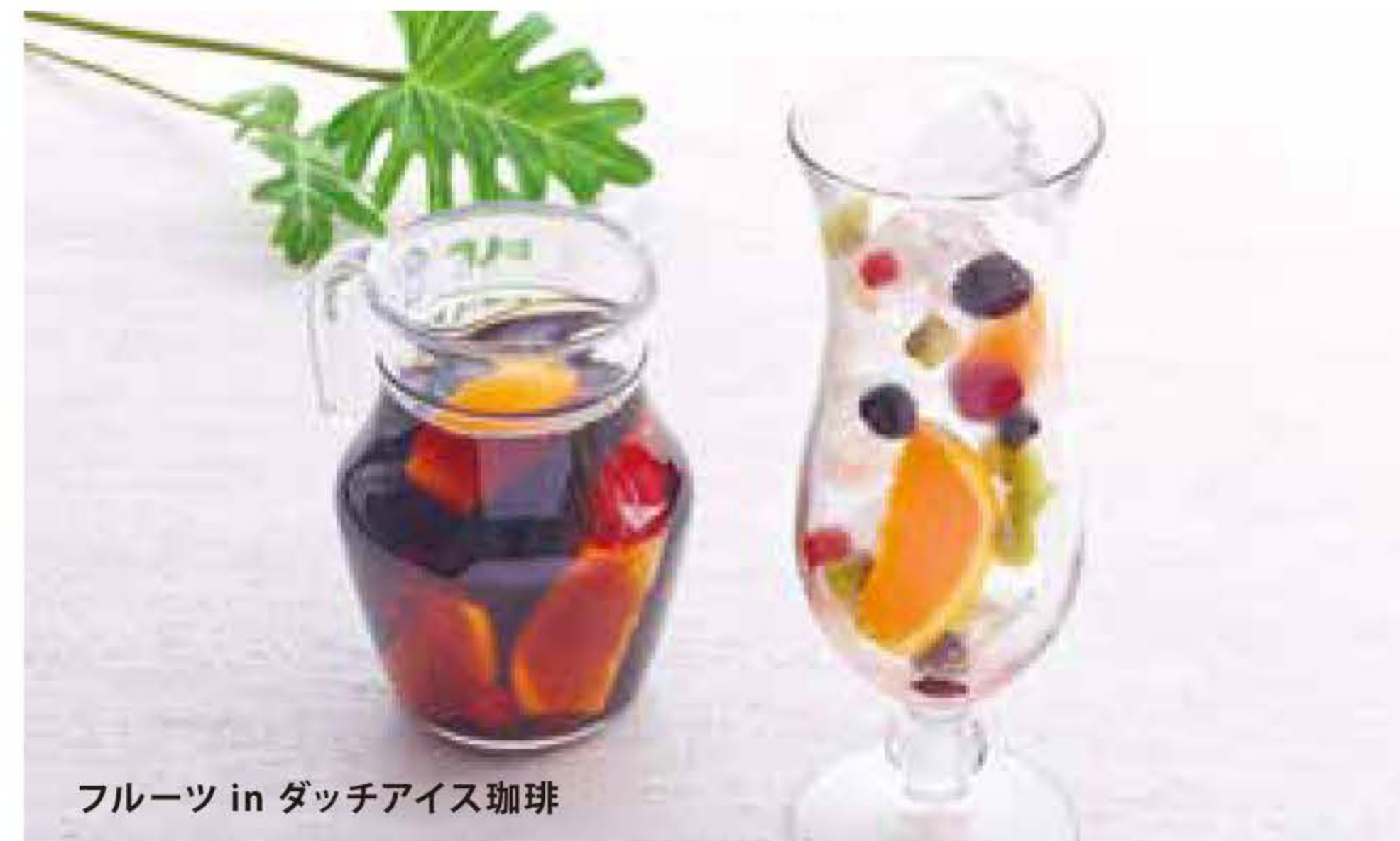
フルーツ in ダッチアイス珈琲