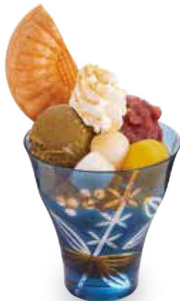
黒蜜ほうじ茶あずきパフェ Hojicha & Azuki Parfait with Brown Sugar Syrup