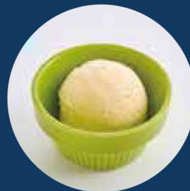
キッズミニアイス (バニラ・チョコ・ストロベリー) Mini Ice Cream (Vanilla, Chocolate, or Strawberry) +¥120