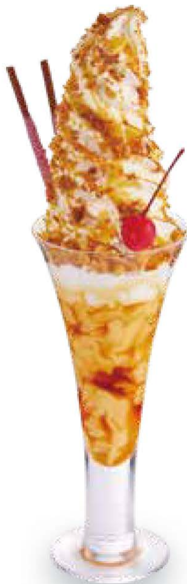
ジャンボソフトパフェ プリン Jumbo Soft-Serve Parfait -Pudding-

ソフトクリームたっぷりのジャンボパフェ。 グラスに自家製プリンを敷き詰めました。