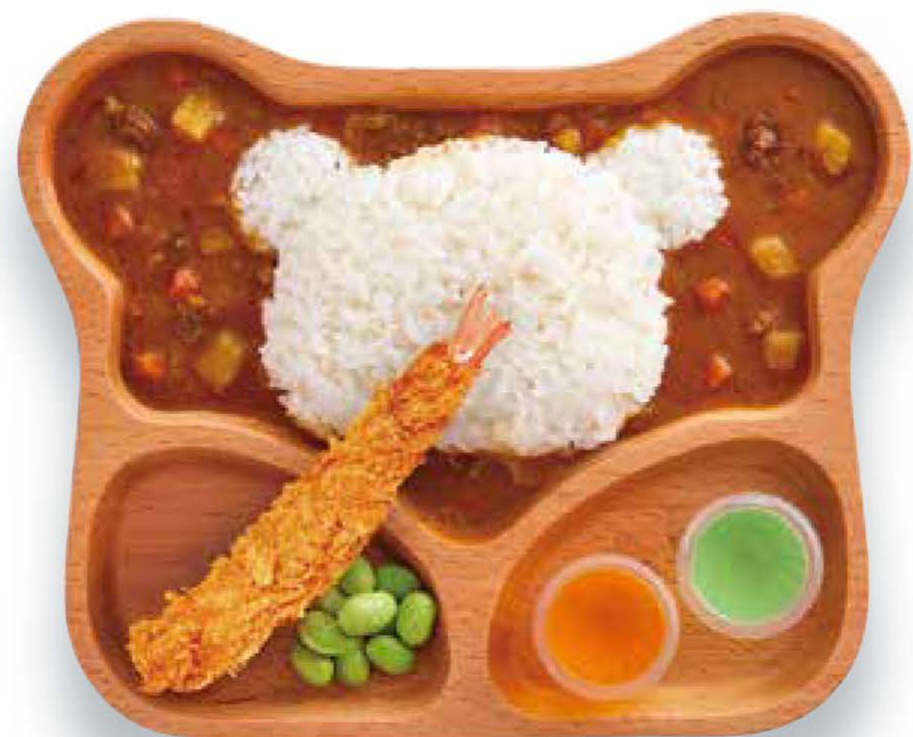
キッズプレート カレーライス Kids Plate -Curry-