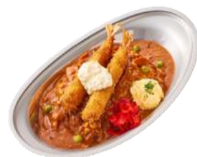
やさしい甘さのハヤシライス

からふね屋といえばやっぱり「パフェ」。当店限定のカレーをかけて仕上げた「 ジャンボカレーパフェ 」(税込 8,000 円、5 名様向け)をご用意しております。容器の底にはコーヒーゼリーやバニラアイスクリームが隠れており、デザートまで一度に楽しむことができます。お一人様でチャレンジはもちろん、グループで写真を撮りながら楽しく取り分けながらご賞味ください。