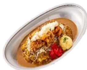
シャープな香りと辛味が特徴の スパイスカレー