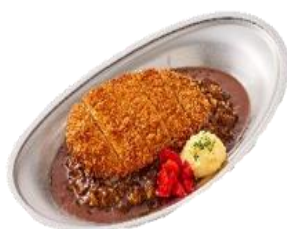
隠し味に“名物ダッチコーヒー”を使用した 味わい豊かな欧風カレー

からふね屋咖喱店では、「気軽に」「手早く」「お腹いっぱい」をコンセプトに、カレーやハヤシライスを税込 650 円から提供します。「欧風」「スパイス」「ハヤシ」の 3 種類の選べるソースをはじめ、ロースカツや鶏唐揚げなどのカレーにぴったりのトッピングもご用意しており、組み合わせることで 50 種類以上のバリエーションをお楽しみいただけます。